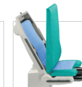
Контейнер для бумажной гигиенической простыни