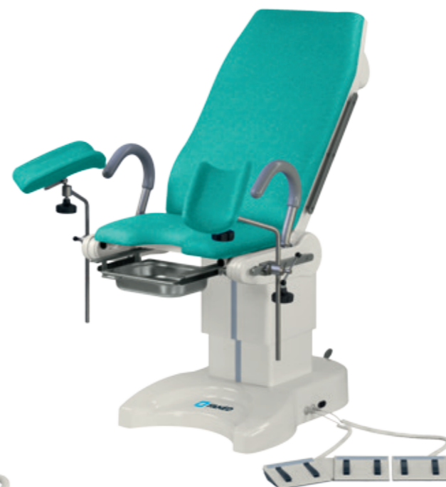
Кресло FG-04.0 с голеностопной секцией WF-22.3