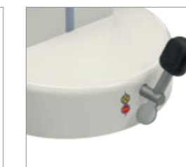
Центральная блокировка колес