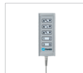
Проводной пульт управления с возможностью программирования положения (опция)