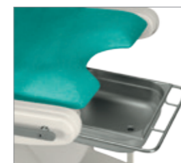
Урологический лоток WF-52.2 (опция)