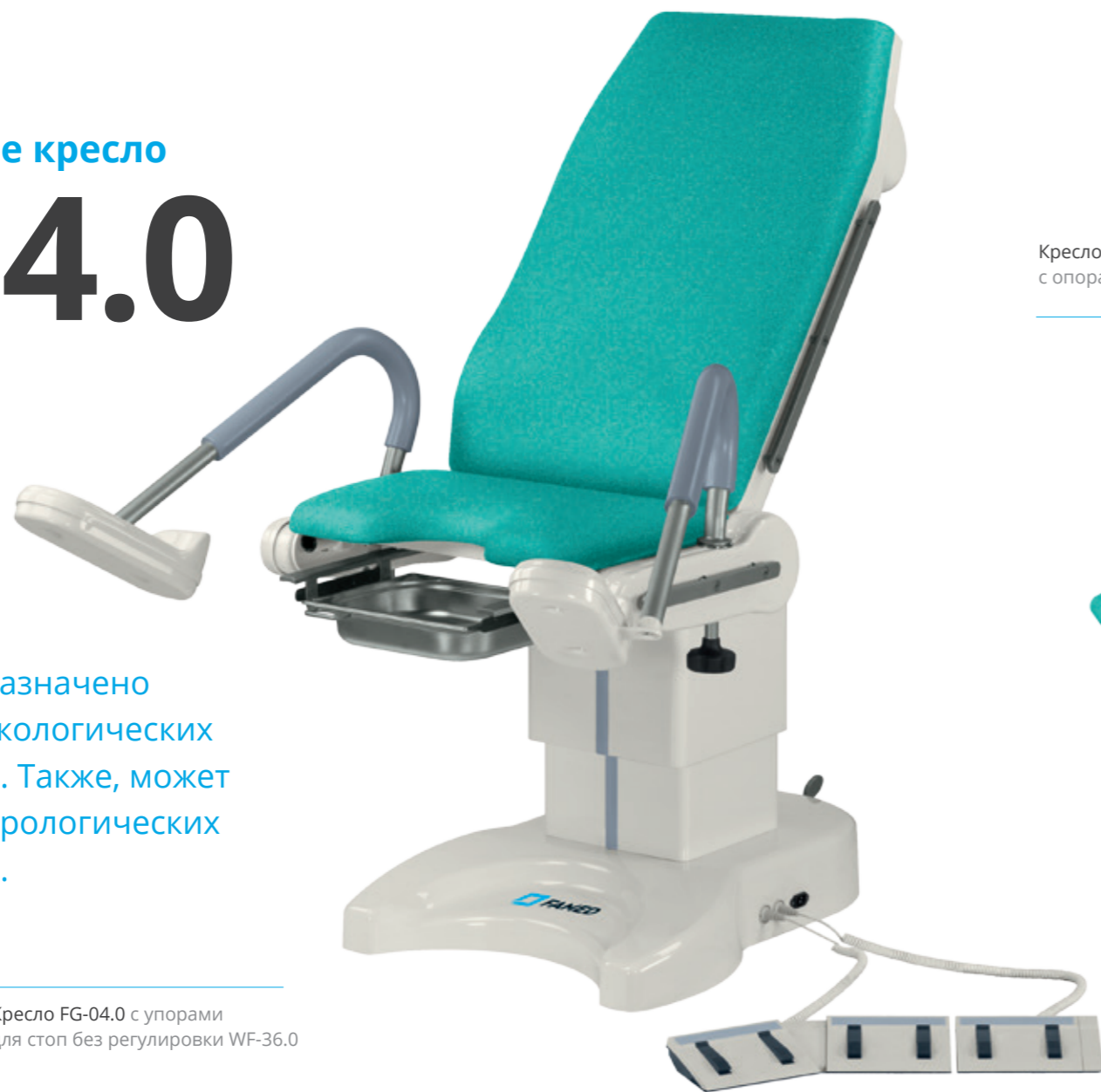
Кресло FG-04.0 с упорами для стоп без регулировки WF-36.0